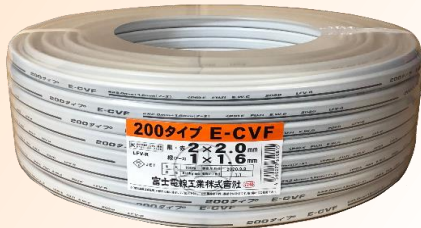
<200タイプ° E-CVF >