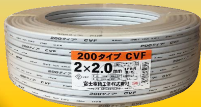
<200タイプ°CVF 2 × 2.0mm>